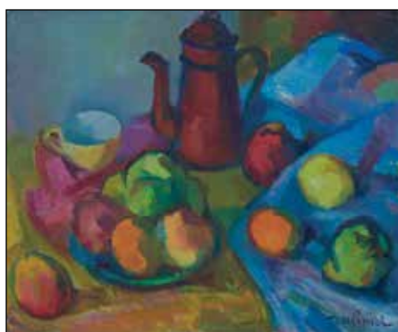
Cafetière et pommes