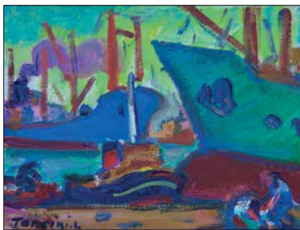
Sur les quais