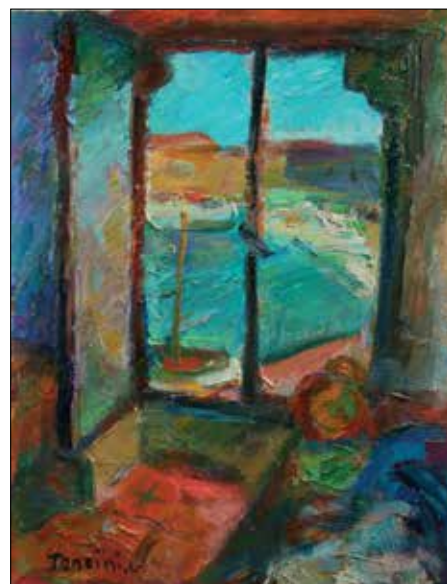
Fenêtre sur Vieux-Port