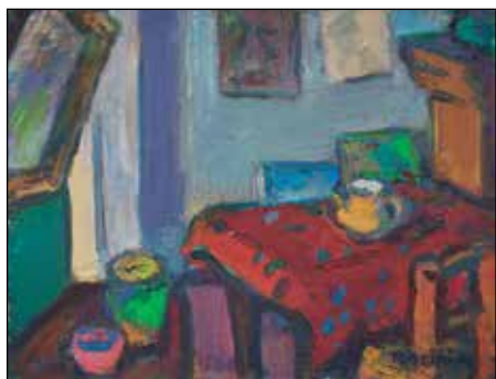
Intérieur à la cruche sur la nappe rouge