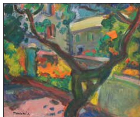
Jardin à Saint-Clément